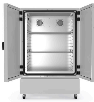
model KBF-S ECO 720