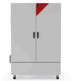
model KBF-S ECO 720